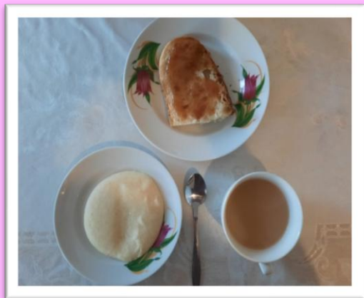
Таңғы ас Жарма ботқасы Нан балмен Сүтті шәй